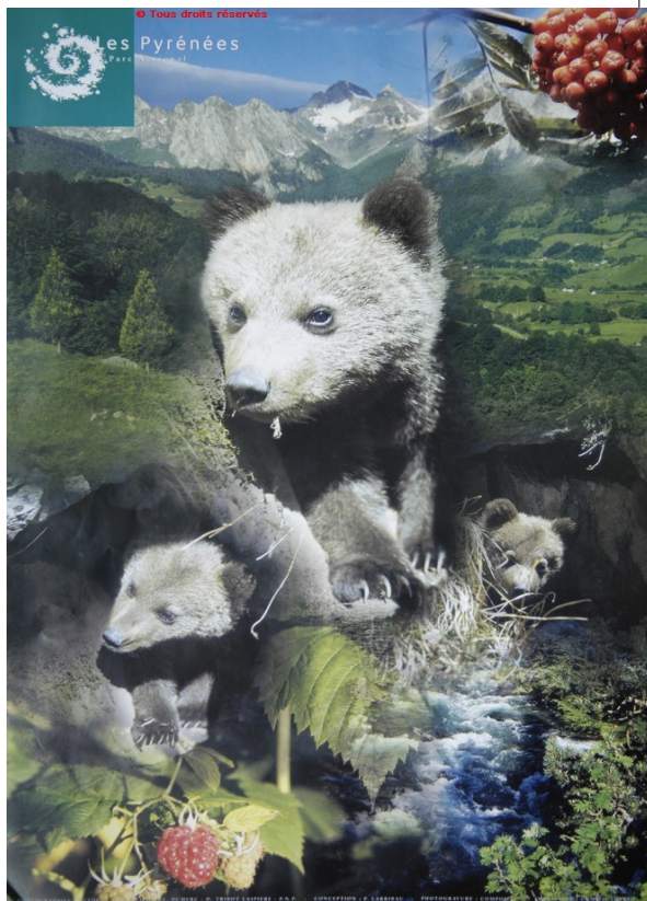
Parc national des Pyrénées, affiche, 1996