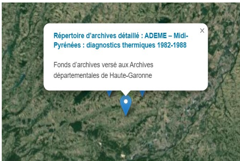
Géolocalisation des fonds d'archives concernant la Haute-Garonne

https://ressources.histoire-environnement.org/Carte?filtre=ressources